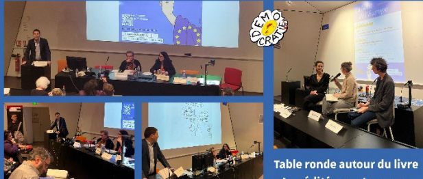
Table ronde «Mitterrand et l'Europe» , animée par Emmanuel Droit, avec Judith Bonnin et Catherine Trautmann. Dessin de presse en direct : Laurent Salles.