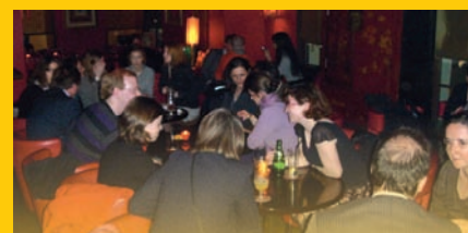
A Paris, nos Anciens ont le plaisir de se retrouver chaque mois pour un apéro ou un dîner : la convivialité et la fraternité sont de toutes les soirées !

Nos prochains événements n'étant pas tous planifiés, cet agenda reste indicatif : les confirmations seront faites par l'envoi d'une invitation par mail. N'oubliez pas de nous communiquer votre adresse e-mail en nous l'envoyant à