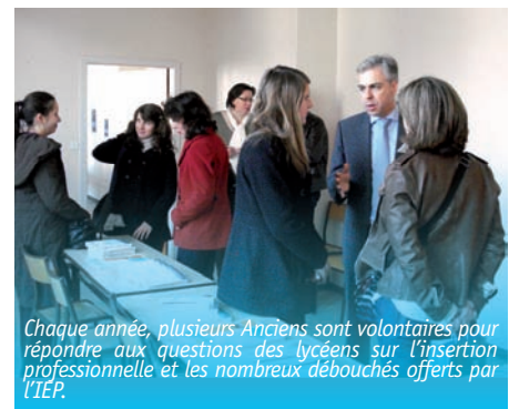
Chaque année, plusieurs Anciens sont volontaires pour répondre aux questions des lycéens sur l'insertion professionnelle et les nombreux débouchés offerts par l'IEP.