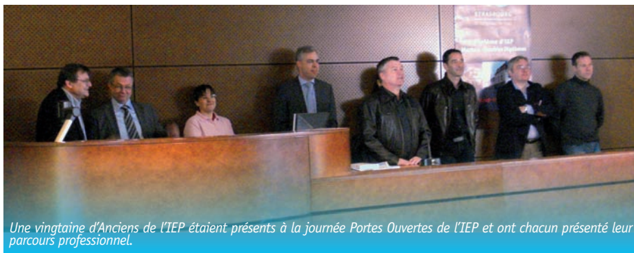
Une vingtaine d'Anciens de l'IEP étaient présents à la journée Portes Ouvertes de l'IEP et ont chacun présenté leur parcours professionnel.

A quelques mètres de l'amphi, et ce pendant toute la journée, une équipe d'Anciens (que nous remercions ici !) a renseigné les familles qui visitaient l'IEP et avaient, comme toujours, mille questions sur les formations et les débouchés après l'IEP.