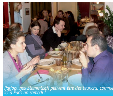
Parfois, nos Stammtisch peuvent être des brunchs, comme ici à Paris un samedi !

Libre à chacun(e) d'entrer en contact avec l'association s'il/elle a pour projet d'organiser un Stammtisch dans sa ville ou son pays !